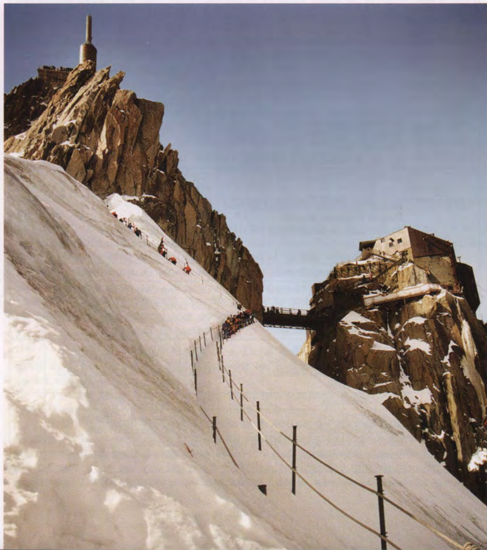
Aiguille de Midi. Autor: Jaume Muntada. Foto guanyadora de la votació popular