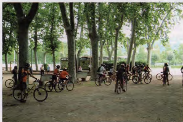
El grup a Girona a l'inici del recorregut

Va ser una sortida molt divertida. Ja de bon matí vam haver de col·locar totes les bicis dins l'autocar, amb una mica d'enginy i desmuntant-ne unes quantes, després, a Girona, les vam tornar a muntar, vam esmorzar, i una vegada preparats vam començar la pedalada. El carrilet, en principi, és una via planera i de poca dificultat, però la veritat és que els últims kilòmetres se'ns van fer