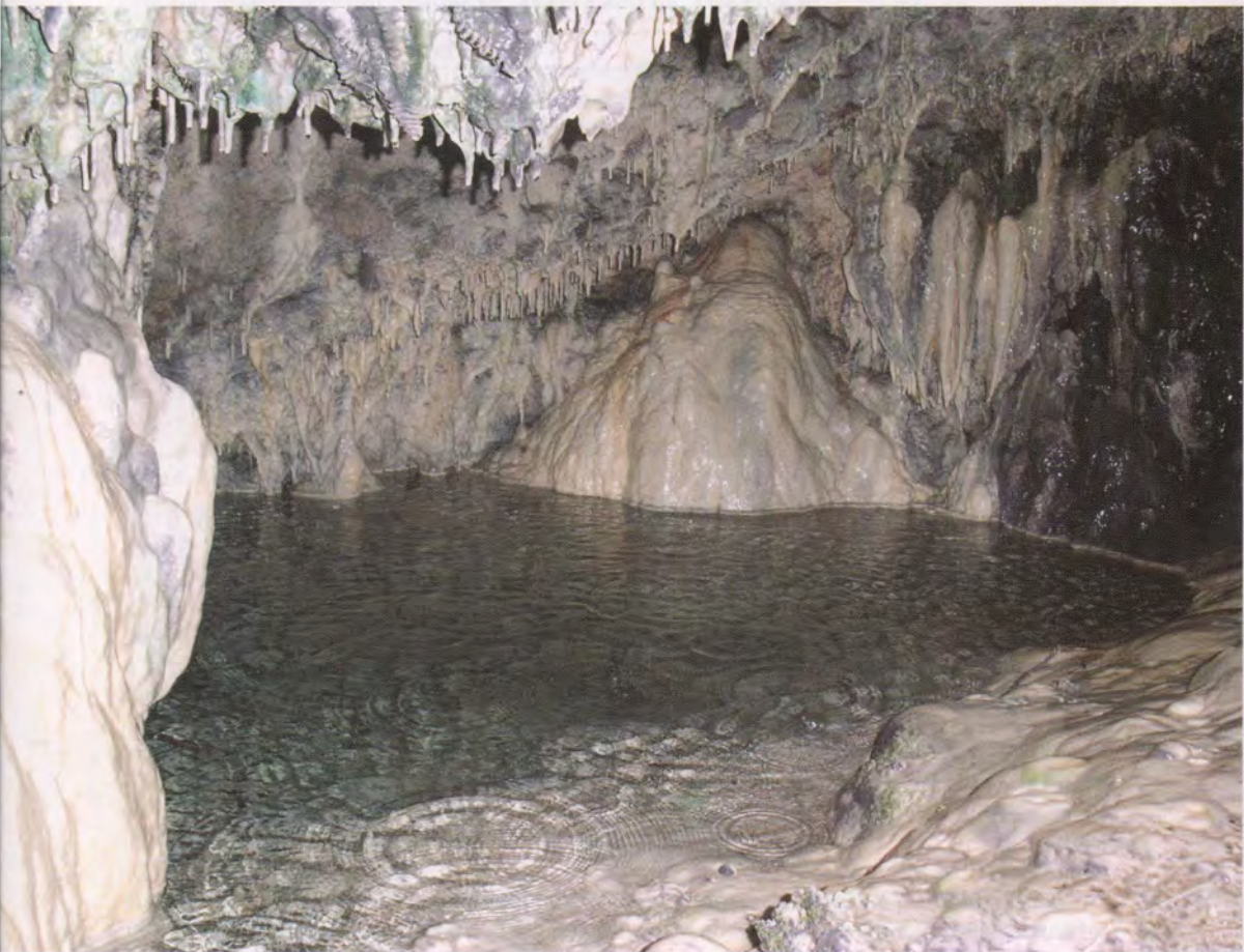
Cova del Moro