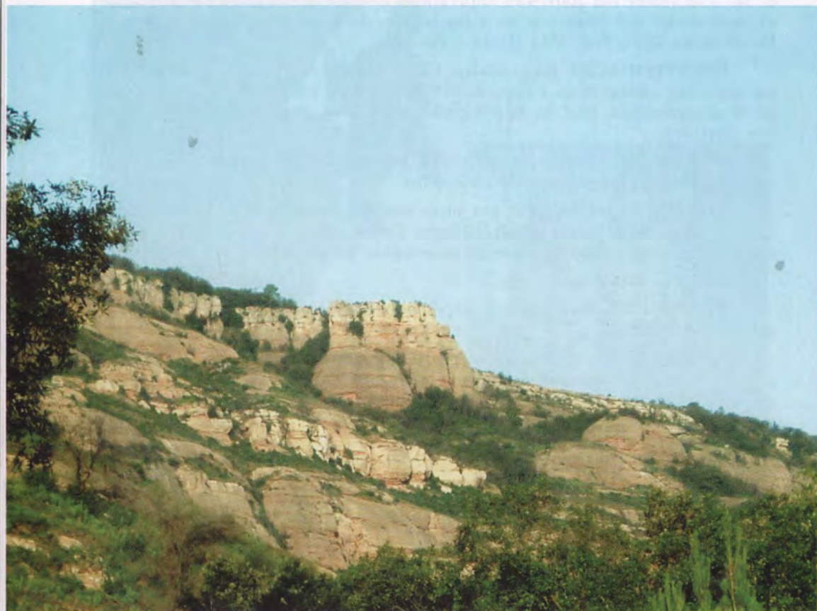
El característic turó del Queixal Corcat, vist des del fons de la vall d'Horta